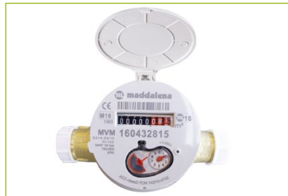
Een analoge watermeter ziet er ongeveer zo uit ↑

Ga naar www.dewatergroep.be/meterstand . Vul je klantrekening en antwoordnummer in. Die vind je terug op onze vraag om je watermeterstand door te geven bovenaan in de rechterhoek .