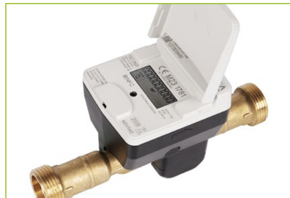
Een digitale watermeter ziet er ongeveer zo uit ↑