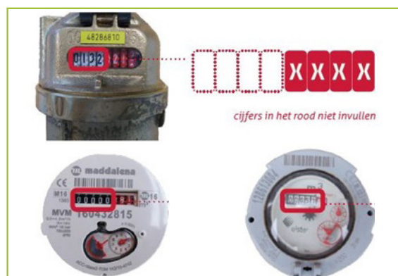
Een analoge watermeter ziet er zo uit ↑

Dan zal je jouw meterstand nog zelf moeten doorgeven. De watermeter stuurt zijn gegevens via de digitale elektriciteitsmeter. Omdat je momenteel nog geen digitale elektriciteitsmeter hebt, kan je digitale watermeter nog geen gegevens naar ons doorsturen. Zodra jouw elektriciteitsmeter vervangen is door een digitaal exemplaar, zal Fluvius de verbinding maken tussen de digitale watermeter en elektriciteitsmeter. Eens de verbinding er is, krijgt jouw digitale watermeter veel meer mogelijkheden en wordt jouw meterstand automatisch naar ons doorgestuurd.